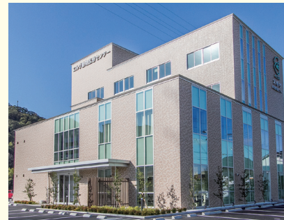
▲エルザ動物医療センター

大切な家族であるワンちゃんやネコちゃんが病気にならないように、予防注射や去勢・避妊手術を実施したり、病気になった子には体のどこの調子が悪いのか検査したり、点滴や注射、手術などの治療をしたりしています。また、ワンちゃんやネコちゃんの日々の生活での相談を受けることも多いです。